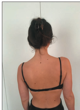
› Figure 2: position de scapula gauche en sonnette médiale et abaissement

L'observation du patient permet également de mettre en évidence des amyotrophies des fosses supra- et infra-épineuses ou des deltoïdes qui peuvent orienter le diagnostic vers d'autres pathologies car le STTB symptomatique ne semble pas provoquer d'amyotrophie des membres supérieurs.