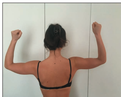
› Figure 3: test de Roos

(Une vidéo de ce test est par exemple disponible ici : https://www.youtube.com/watch?v=rM4fb-t_I9E )