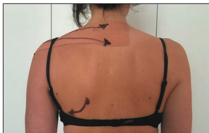
› Figure 4: application de bande de Tape permettant de positionner la scapula vers le haut et en sonnette latérale

Une modification de la position de la scapula peut également être proposée lors de la réalisation du test. Elle peut être réalisée manuellement par le physiothérapeute qui place la scapula le plus souvent en élévation et sonnette latérale (rotation vers le haut). Elle peut également être réalisée par l'application de bandes de Tape rigide. (Figure 4)