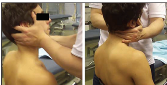
› Figure 3: technique de manipulation de type composante multiple en assis

L'étude des effets biomécaniques de la manipulation cervicale sur la rotation axiale passive du rachis cervical s'est réalisée en une seule séance. Nous avons d'abord installé les sujets dans notre dispositif de mesure et réalisé trois rotations bilatérales servant à habituer les sujets aux sensations. Ensuite, trois rotations bilatérales ont été enregistrées, puis les sujets ont été détachés et ont dû s'asseoir sur une chaise. Un praticien ostéopathe ayant plus de quinze ans d'expérience a alors testé la mobilité du rachis cervical pour trouver une restriction de mobilité sur un ou plusieurs niveaux vertébraux, qu'il a alors manipulé(s). La manipulation était de type composante multiple, en assis (cf. figure 3). Enfin, les sujets ont été immédiatement réinstallés dans notre dispositif de mesure et trois dernières rotations bilatérales ont été enregistrées. Comme c'est le praticien qui décidait du ou des niveau(x) qu'il voulait manipuler en fonction de son ressenti, il n'y a donc pas eu de contrôle du niveau de la manipulation.